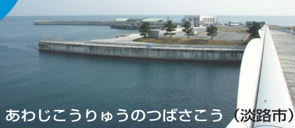
あわじこうりゅうのつばさこう (淡路市)