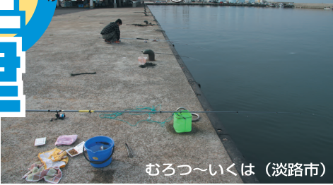
むろつ〜いくは (淡路市)