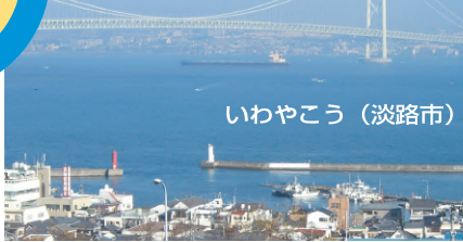
いわやこう (淡路市)