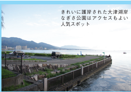
きれいに護岸された大津湖岸 なぎさ公園はアクセスもよい 人気スポット