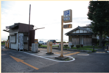
広大な大津湖岸なぎさ公園には各所に有料駐車場とトイレがあり非常に便利

■琵琶湖文化館周辺には東西に大津湖岸なぎさ公園が延々と広がり足場がよく有料駐車場、トイレが整備されているのでオールシーズン釣り人の姿が絶えない。特に東の「におの浜」方面にかけてがバスの越冬場になっておりロクマルも期待できるところで冬場はアングラーがずらりと並ぶ。水深は足元で1.5m、20mほど沖で2.5mぐらい。メタルパイプの遠投や春先はスコーンリグなどでねらうとよい。文化館から西、浜大津港までの区間はライトリグでの数釣りも面白い。