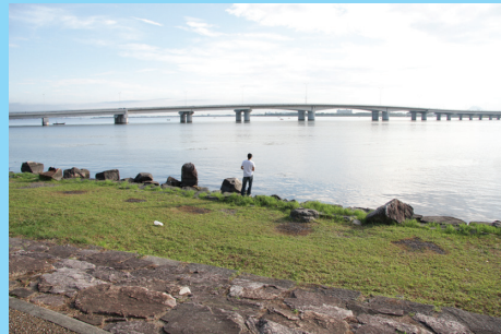
膳所城跡公園の周囲は足場がよく釣りやすいが非常に浅いので南のなぎさ公園の護岸に比べると期待薄。間近に近江大橋が見える