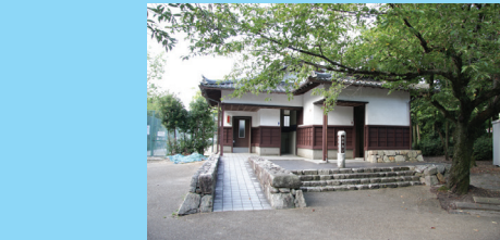
膳所城跡公園内にはトイレや飲料の自動販売機もあるので、家族連れには最適