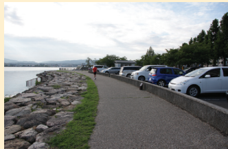
車は大津湖岸なぎさ公園の有料駐車場に止める。トイレもあるので便利