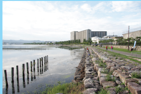
大津湖岸なぎさ公園の護岸は、琵琶湖文化館あたりと同様に階段状になっており非常に釣りやすい

■膳所城跡公園から南に続く大津湖岸なぎさ公園までのエリアはオールシーズン、大中小のオールサイズのバスが釣れる人気釣り場。瀨田川に近く流れがあるのでバスが多く、とくになぎさ公園の護岸がベストポイント。膳所城跡公園の周囲は非常に浅いため敬遠する人が多い。年中釣れるがとくにおすすめは春。スコーンリグの遠投で全層をチェックしたりラバージグでボトムのスル引きが効果的。真夏はウィードが多いのでスイムベイトのテキサスリグで表層、トップをねらう。