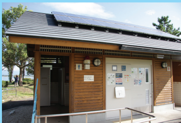
ソーラー発電を利用し水を循環させるエコリサイクルトイレ。土を使って水をきれいにし再利用している