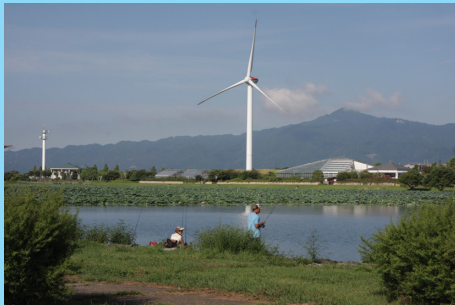
風車があるの烏丸半島の間はヨシ群落保護地区に指定されており動力船での侵入は許可が必要