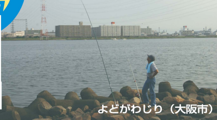
よどがわじり (大阪市)

■大阪都心部を流れる淀川(新淀川)は意外な穴場。汽水域なので釣れる魚種は限られるが、チヌにキビレ、スズキ、ハネ、セイゴ、ハゼなどの魚影はすくぶる濃い。全体に水深はないので竿の真下を狙うサビキ釣りには不向き。ブツ込み釣りがメインだ。シーバス狙いのルアーでランガンもいい。最下流の矢倉海岸にはサヨリも回遊。問題なのは車の置き場。両岸とも全域が駐車禁止なのでタイムスなどパークキング利用が無難。もしくは電車、徒歩での釣行がおすすだ。