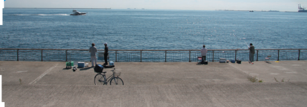
みなみあしやはま (芦屋市)

■ヨットハーバー（ベルポート芦屋）と潮芦屋ビーチ以外の、周囲どこからでも竿を出せる大きな埋立地で、北岸の水道部、西岸が石畳、南岸と東岸の一部が手すり付きベランダで、足場もよく安全。駐車場、トイレも多いのでファミリーフィッシングに最適の場所。釣りものも豊富で、ポイントさえ間違わなければサビキ釣りから探り、ブツ込み、エビ撒き釣り、落とし込み釣り、ルアーとあらゆるジャンル釣りが楽しめる。浅い石畳では竿下のサビキ釣りが難しい。