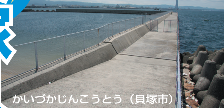
かいづかじんこうとう (貝塚市)