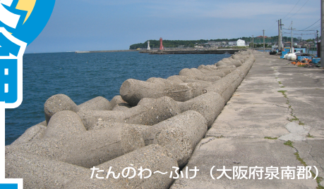
たんのわ〜ふけ (大阪府泉南郡)

★みさき公園裏★釣りは東側の小突堤がある浜と、西側の岩場の海岸に分かれるが、車で入りやすいのは東側。古くから投げ釣りのポイントとして有名だが近年はアオリイカのエギングで脚光を浴びている。春は2キロオーバーの大型も出る