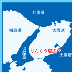
りんくう公園は釣り禁止

初夏～秋は投げ釣りやキス、夜間はアジング、メバリングが面白い。背後の公園ではバーベキューができるスペースもあるのでファミリーやグループに最適