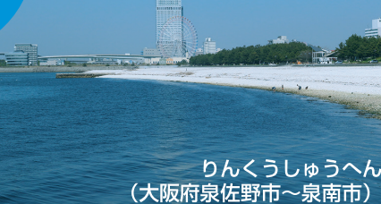
りんくうしゅうへん (大阪府泉佐野市～泉南市)

■関西空港へのアクセスポイントである「りんくうタウン」から南に続く「マーブルビーチ」と「田尻漁港」がイチオシ釣り場。マーブルビーチ横の有料駐車場を利用すればビーチに続く漁港外側のポイントへも徒歩ですぐ。白い石が敷き詰められた海岸からはスカイゲートブリッジ、関空島と景色もよくファミリーやカップルでの釣行にぴったり。トイレも併設されているので女性も安心だ。岡田浦漁港では毎週日曜の朝7時から地元で獲れた鮮魚などを販売する市が立つ。