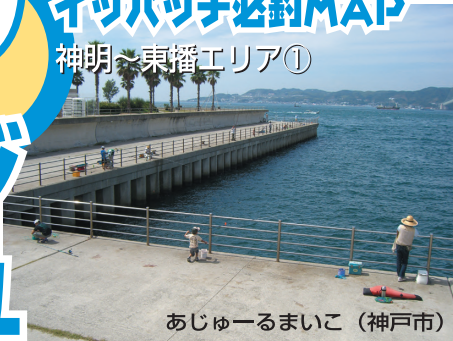
あじゅーるまいこ (神戸市)

■明石海峡大橋の真下にある整備された護岸一帯が「アジュール舞子」と呼ばれる釣り場。フラットで広い足場は手すり付きで子供連れでも安心。特に「アジュールワンド」と呼ばれる凹み部分は明石海峡の急潮の影響を受けにくく釣りやすいので手軽にサビキ釣りなどを楽しむファミリーフィッシングに人気。一方で潮が速い凹み以外の場所ではルアーで青物を狙ったりエギングでアオリイカを狙うマニアも多い。夏の夜に良型のサバが釣れることも知られる。