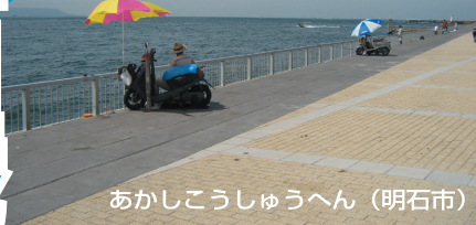
あかしこうしゅうへん (明石市)

■明石港周辺へはマイカーでの釣行も便利だがJR、山陽電鉄の明石駅から駅前の大通りを真っ直ぐ南へ向かえば徒歩でもそれほど遠くない。おすすめは市役所裏から明石港へ続く海浜ペランダ。手すりがある広い護岸で子供連れでも安全に釣りが楽しめる。ただし外側は明石海峡を流れる速い潮が通るので、潮止まり前後の時間帯や小潮回りの日の釣行がおすすめ。サビキでねらうアジやイワシなど小物からルアーのシーバス、タチウオ、投げ釣りのカレイなど魚種は多岐。