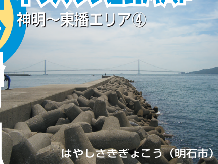
はやしきぎょこう (明石市)