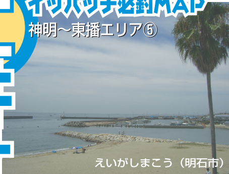
えいがしまこう（明石市）

■サーフが続く林崎から東二見までの単調な海岸線のなかで、播磨灘に突き出すように造られたのが江井ヶ島港だ。水深があり潮通しもよいため、多くの魚種が集まり好釣り場になっている。古くからカレイやキスなどの投げ釣りでは知られていたし、周辺のサーフにある小突堤も投げ釣りが面白い。このエリアではタチウオが狙える数少ないフィールドだ。港入口付近には有料駐車場、トイレもあるので家族連れでサビキ釣り、チョイ投げなどを楽しむのもよいだろう。