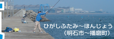
ひがしふたみ～ほんじょう (明石市～播磨町)

■明石市の西端に位置する東二見と播磨町の本荘にまたがって広大な2つの人工島があるが立入禁止、釣り禁止区間も多いのでルールを守ってほしい。本命の沖向き海岸線のほとんどにテトラが入っており足場が悪い。そんななか比較的 safely に釣りができるのは本荘人工島の西端に延びる赤灯波止。潮通しがよくさまざまな魚が狙えるが波に弱いので荒れてきたら早めの撤収を心がけてほしい。以前、好ポイントだった東二見人工島の北東にある波止、古宮漁港は立入禁止。