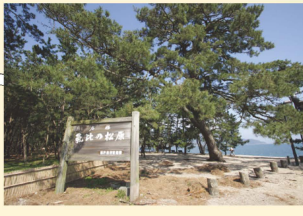
遊歩道があるので松原を散策するのも楽しい

■敦賀湾の最奥部、日本三大松原のひとつである氣比の松原を抜けたところが松原海岸。広々とした砂浜で投げ釣りのキス、カレイが面白い。釣った小型キスをエサにしたリルアーでマゴチやヒラメが釣れるかも。夏場は海水浴場になるので夏の日中の釣りは遠慮しよう。くれぐれも釣りバリや仕掛け類、ゴミを放置しないように心掛けたい。浜の中央部に無料駐車場がありトイレもあるので便利。浜の西詰めに流れ込む井ノ口川の河口部ではチヌのほかサビキでアジがねらえる。