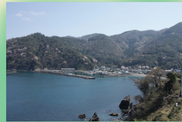
世久見港はアオリイカの好ポイント。フカセのチヌやグレも面白い