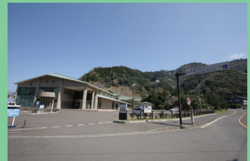
食見海水浴場には福井県海浜自然センターの建物があり、その周囲に駐車場が併設されている。トイレもあるので非常に便利