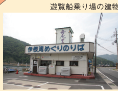
伊根湾めぐり 遊覧船乗り場