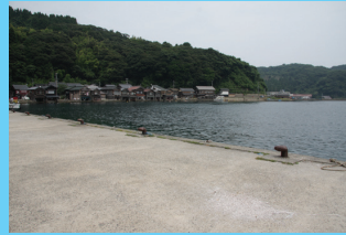
平田港の埋立地は広くフラットで海面からも近く初心者にもやさしいポイント。根魚、アジのサビキがおすすめ