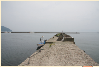
養老漁港の南側にある波止。両サイドでサビキや投げ釣りができる