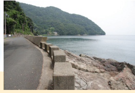
亀山の南に続く自然海岸。道路のところに駐車スペースがある