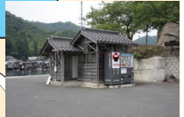
平田港の埋立地にはトイレ、飲料の自販機がある

■舟屋で有名な伊根港周辺は日本海では珍しい南に向けたエリアで冬の季節風にも強い釣り場。ただ釣りができる場所は少なく、有料駐車場とトイレ、飲料の自販機がある平田港の埋立地、亀山南側の自然海岸、伊根手前の養老漁港がおすすめです。平田港の埋立地は足場もよくファミリーフィッシングに最適で対岸の舟屋を眺めながら釣りができる。サビキのアジや根魚がメインのターゲット。養老漁港はまん中の波止付け根付近にトイレがあるので便利。